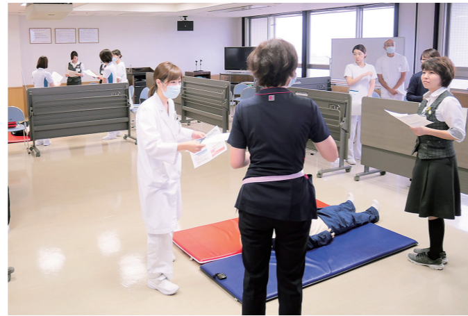
BSL(一次救命処置)研修

今後もこのような研修を行い、今以上に信頼される良質な医療を提供できるよう努力してまいります。