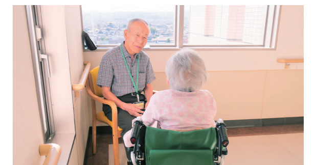
傾聴ボランティア「うさぎ」さんの活動