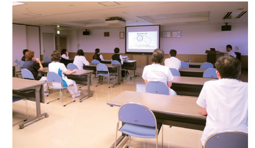
映像での事前学習

医師、看護師とは違い普段医療に携わらない職種の者にとって胸骨圧迫が初めてということは少なくありません。そのためはじめに実践講習を受けるのではなく、まずは映像で手順を確認していきます。