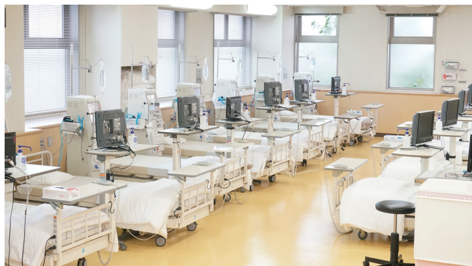
改装が完了した人工透析室

今回の改装で、人工透析室は、明るく、少しゆとりのある空間になりました。患者様には、より一層心地の良い空間を提供できれば幸いです。これからも地域の腎臓病の患者様に快適で安全かつ適切な医療を提供できます様、スタッフ一同努力して参ります。